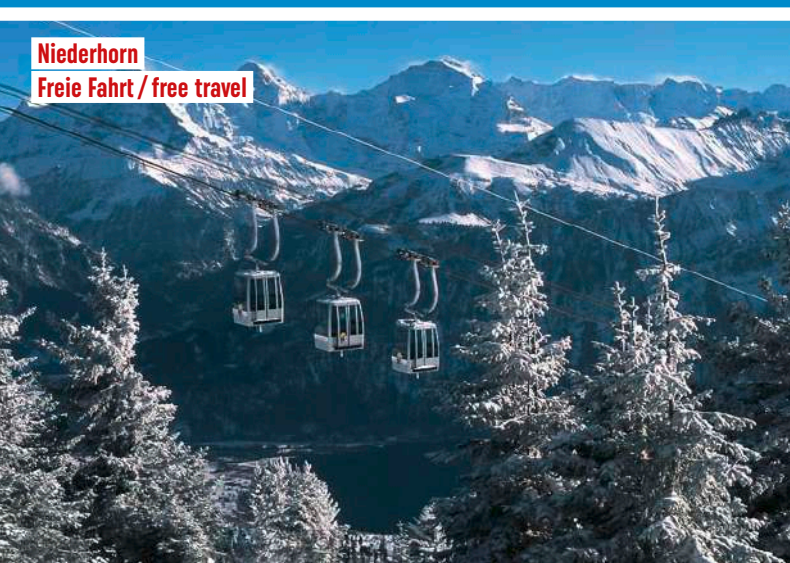
Niederhorn Freie Fahrt / free travel