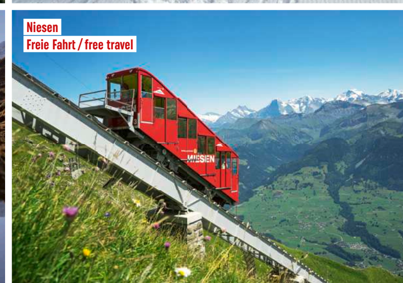
Niesen Freie Fahrt / free travel