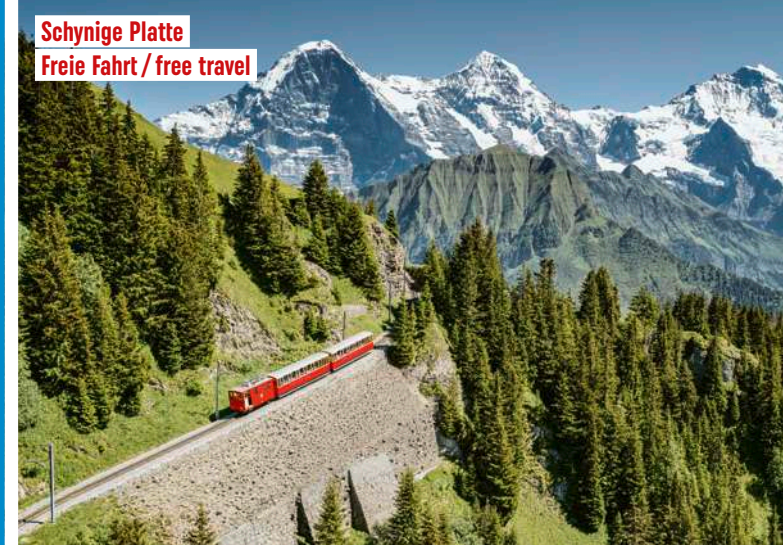
Schynige Platte Freie Fahrt / free travel