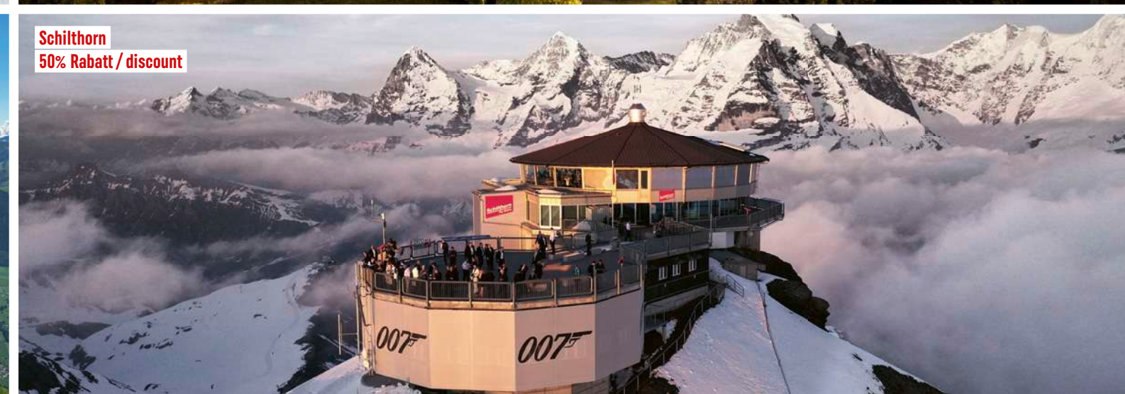
Schilthorn 50% Rabatt / discount