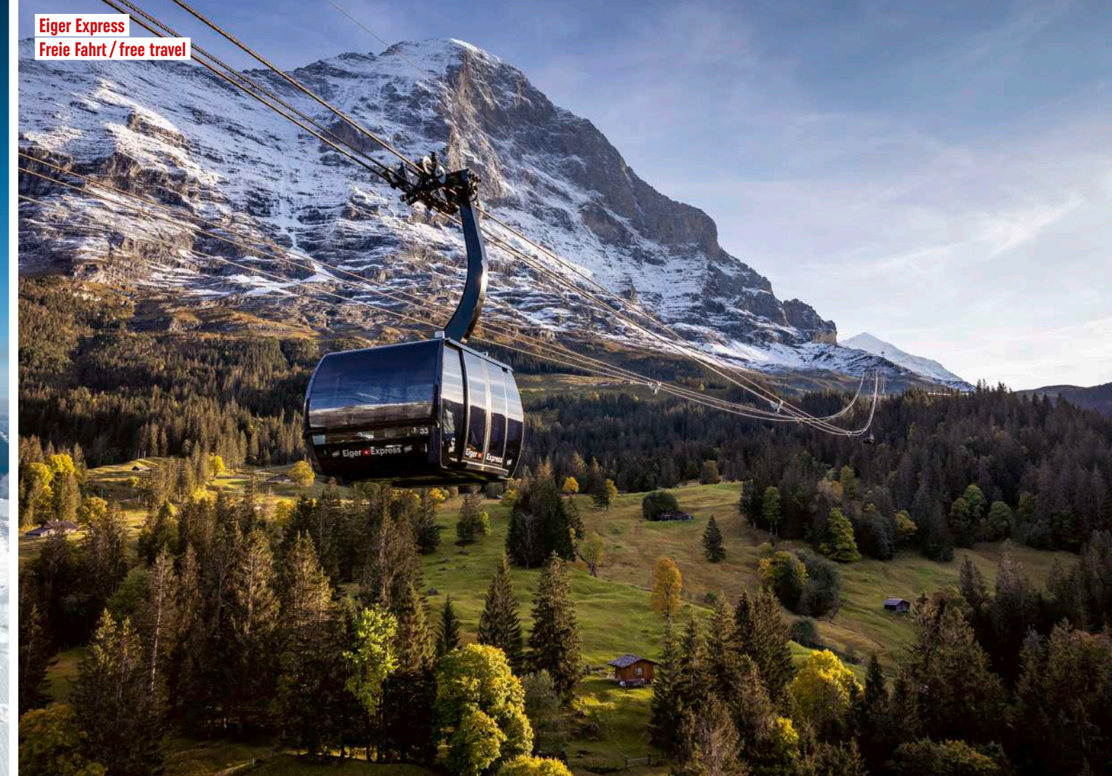
Eiger Express Freie Fahrt / free travel