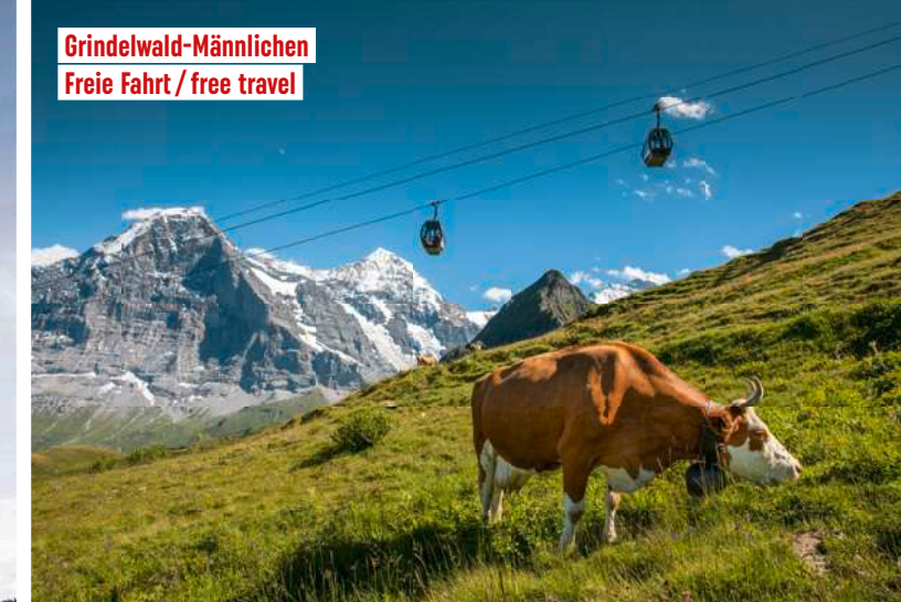
Grindelwald-Männlichen Freie Fahrt / free travel