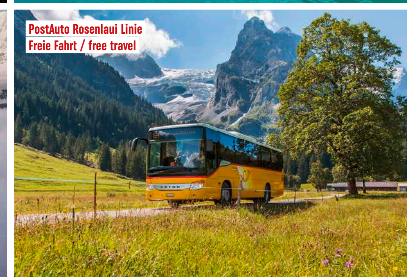
PostAuto Rosenloui Linie Freie Fahrt / free travel