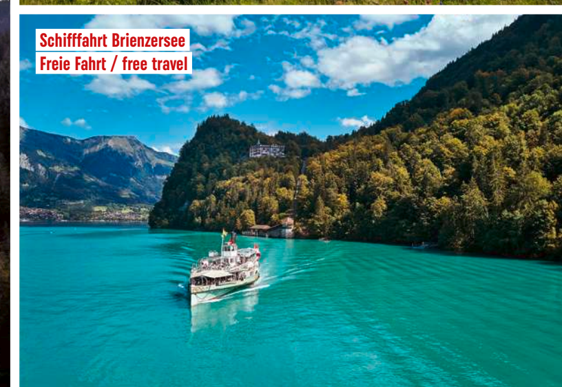
Schiffahrt Brienzensee Freie Fahrt / free travel