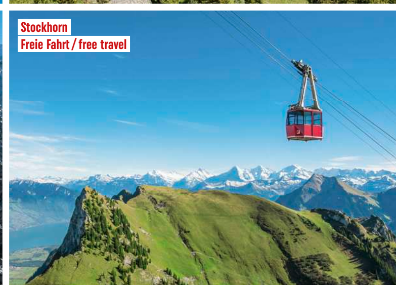
Stockhorn Freie Fahrt / free travel