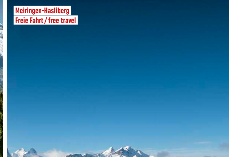
Meiringen-Hasliberg Freie Fahrt / free travel